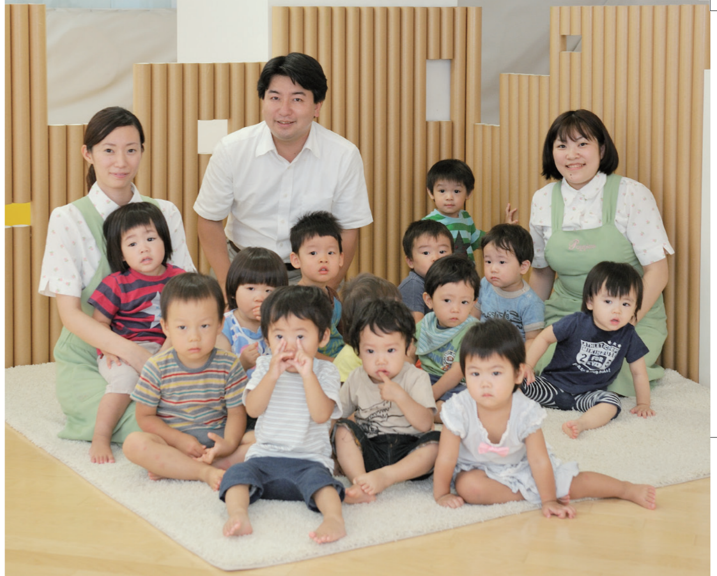
「ポピズナーサリー 早稲田」では、0歳から五歳までの子どもを、およそ七五名ほどあずかっている。