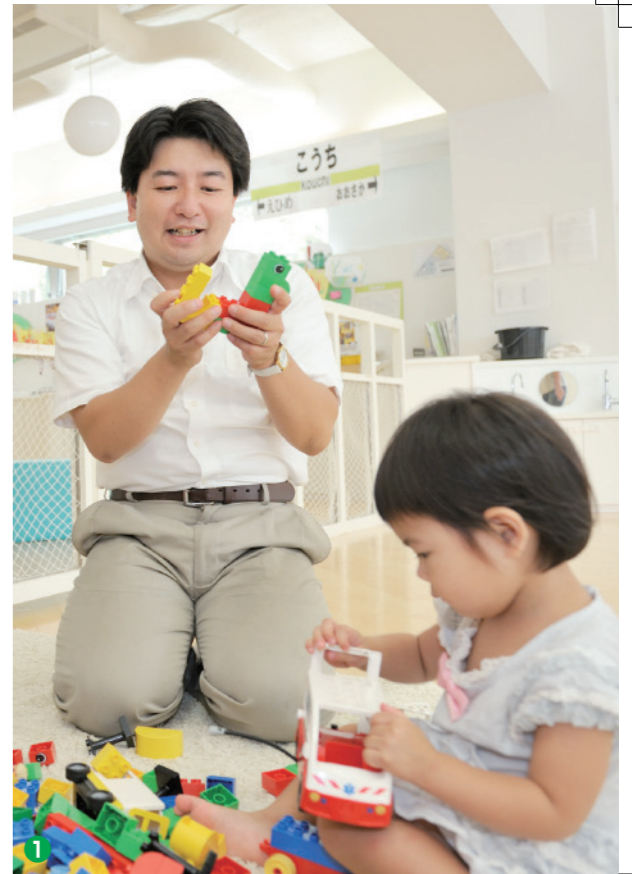
1 絵本を読んだり、手遊びをしたり、音楽に合わせて踊ったり。雷児も子どもたちと一しょになって楽しんでいるようだ。