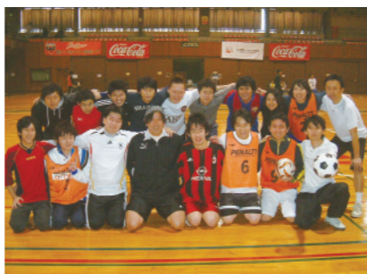
雷児の呼びかけで結成された、男性保育士のフットサルチーム。男性保育士ならではの悩みや情報を交換する場になっている。