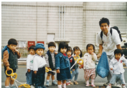
初めての勤務先「横浜市市民病院 内保育所」の園児たちと。

雷児は、心の中でため息をついた。どうしようかと思ったとき、おもちゃ箱の中にビニールのやわらかいボールを見つけた。