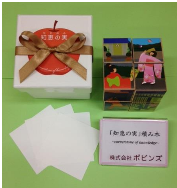
商品の外箱と、シールを貼った状態の積み木