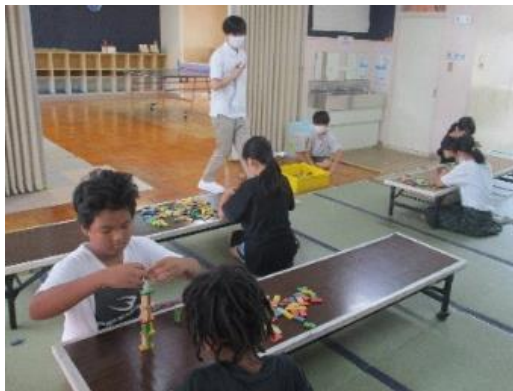
ドミノタワーの実験