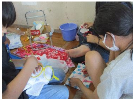
ポイを変えるジュニアボランティア 当日も各ブースで大活躍でしたね！