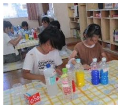
スライム・ スーパーボール作り