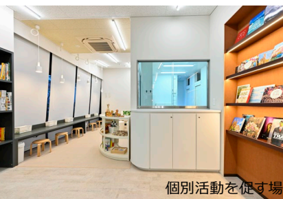
個別活動を促す場