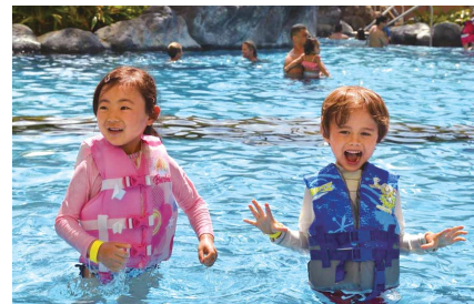
オーストラリアやカナダからの利用者也増えており子ども同士の国際交流も活発に

[ご予約] www.poppins.co.jp/hawaii/contact_reservation/