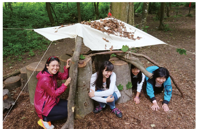
フォレストスクールでは木の果のを見つけ方やロープの結び方なども習得