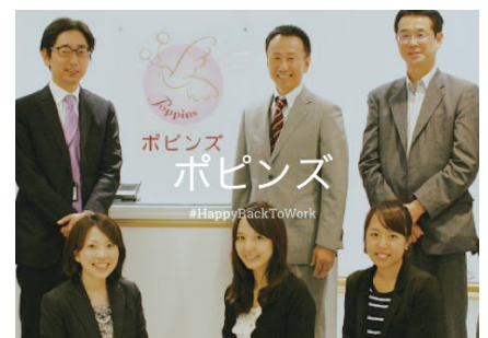
年間500件の託児イベントを行っているポピンズでは職場でのファミリーイベントも提案

www.womenwill.com/japan/supporters/5704221898833920