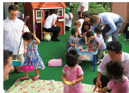
スクールのパティオにて開催

[お問い合わせ] 03-5791-2105 または palis@poppins.co.jp