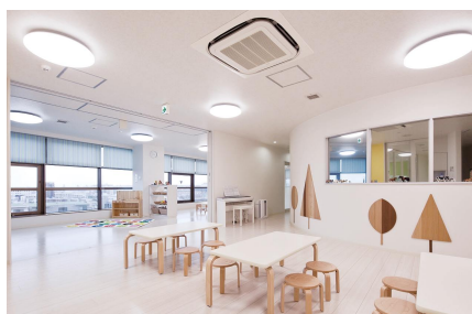
ポピンズナーサリースクール札幌白石

「ポピンズナーサリースクール市ヶ谷」新宿区の認可保育所として2園目、定員50名、来年4月には増床し80名になる予定です。