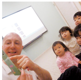
ネイティブの先生が英語で誘う絵本の世界に子どもたちも興味津々

[お問い合わせ] 03-5785-2131 または activelearning@poppins.co.jp