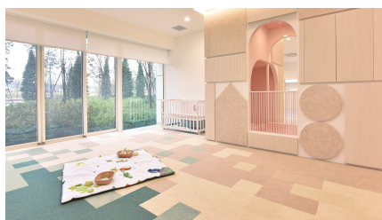
「ポピンズナーサリースクール晴海分園」