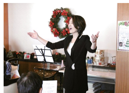
元タカラジェンヌによる歌や音楽は圧巻

[お問い合わせ] ポピンズ芦屋サロン 0797-26-8455 または https://www.poppins.co.jp/vipcare/ashiya/