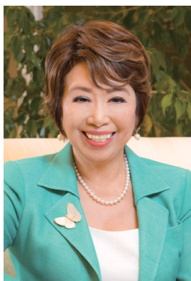
株式会社 ポピンズ 代表取締役CEO