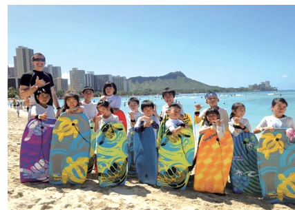
高学年からはワイキキビーチにてボディーボード体験が可能

日系企業としてはハワイ州唯一の公認キッズルーム「ポピンズケイキハワイ」。シェラトンワイキキのオーシャンビューの部屋で世界中から訪れる子ども達をお預かりしています。室内でのホリデープログラムは海をテーマにしたジュエリー作りや、ハワイアンカルチャー体験クラス（フラダンスやウクレレ教室）。アウトドアで人気のクルーズツアーではウミガメの親子が挨拶をしにボートに急接近する場面も！春のプログラムは3月15日まで開催中。詳細はフェイスブックへ。 www.facebook.com/poppinshi [ご予約] www.poppins.co.jp/hawaii/contact_reservation/