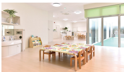
「ポピンズナーサリースクール馬込」