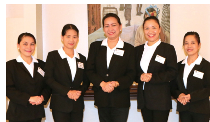
ポピンズのフィリピン人家事スタッフは、全員が大学卒または看護師資格取得者というプロフェッショナル

[お問い合わせ] 03-3447-6131 または kaji@poppins.co.jp