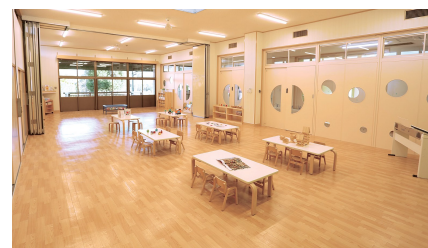
「トントンキッズ・こが」