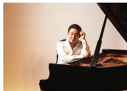
横山先生のプログラム監修は開校以来7年目に

2016年10月9日(日)、アクティブラーニングスクール（東京ミッドタウン）でミュージックプログラムの監修を担当するピアニスト横山幸雄先生による親子のためのコンサートを開催しました。モーツァルト『キラキラ星変奏曲』、ショパン『幻想即興曲』『英雄ポロネーズ』等、世界的ピアニストによる美しい音色は、参加者を魅了。今後も、こうした生演奏の芸術に親子でふれて頂ける機会を提供していきます。 [お問い合わせ] 03-5785-2131 または activelearning@poppins.co.jp