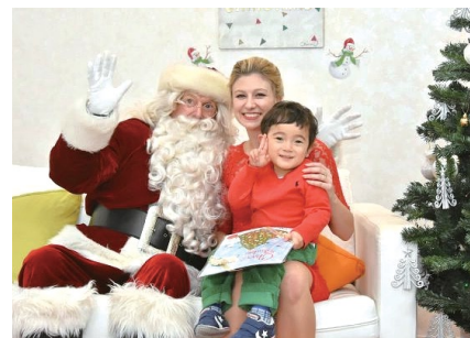
サンタからの本のプレゼントに満面の笑み

恵比寿ガーデンプレイスの美しい環境の中にあるポピンズアクティブラーニングインターナショナルスクール (PALIS) では、英語が初めてでも参加可能な短期プログラム“Be Our Guest”を行っています。ジンジャーブレッドハウスやくみ割り人形の劇を作り上げ、英語だけではなく、五感を刺激するプログラム、またクリスマスには、サンタとの合唱が行われました。イギリスの教育カリキュラムを取り入れ、遊びながら英語と日本語の習得を目指すエデュケアを是非ご体感ください。プログラムはWebにて随時更新中です。 www.poppins-palis.jp/ [お問い合わせ] 03-5791-2105 または palis@poppins.co.jp