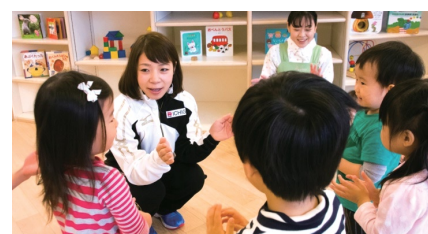
三宅選手は人生初の絵本の読み聞かせにも挑戦