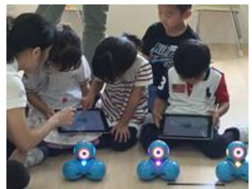
顧客満足度 100%をいただいた PALIS