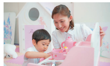
ポピンズ託児スペース

東京都は、待機児童の解消に向け平成30年度から「ベビーシッター利用支援事業」を実施しています。本事業のベビーシッターとなつていただける方を広く募集するため、12月21日に「ベビーシッター募集セミナー」が渋谷で開催され、ポピンズおよびスマートシッターが出展致しました。今回のセミナーでは、ポピンズが受託した託児スペースも併設されました。詳しくは、こちら ( https://www.poppins.co.jp/news/11324/ ) をご覧ください。