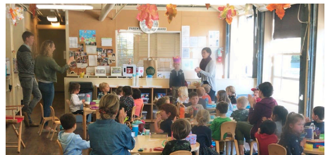
ローンマウンテンスクール

“素晴らしい失敗（Fantastic mistakes）の壁”なるものがあり、“失敗は恐れるものではない、そこから学べる素晴らしいもの”という概念に子ども達を導いていました。失敗を恐れずという言葉自体が、大人にとっては、“失敗は恐れるもの”という固定観念として根付いていることに、目から鱗が落ちました。