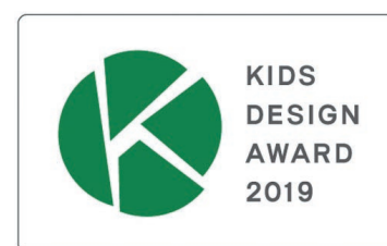
キッズデザイン賞受賞

スマートシッターは2019年7月に5周年を迎え、全国保育サービス協会 (ACSA) にマッチングサービスとして初めて入会が認められました。これにより、スマートシッターの自治体助成は合計22自治体へと拡大しています。また、昨年につづき二年連続で第13回キッズデザイン賞を受賞致しました。キッズデザイン賞は、キッズデザイン協議会が主催し、経済産業省、内閣府、消費者庁が後援する優れた製品・サービス等を選び、広く社会に発信していくことを目的に創設された顕彰制度です。「第13回キッズデザイン賞」では受賞作品264点が発表され、スマートシッターは、キッズデザイン賞 (子どもたちを産み育てやすいデザイン部門) を受賞致しました。今後も一層の研修の徹底や保険の充実を進め、質の高い新しい形のマッチングサービスとして運営して参ります。詳しくは、こちら ( https://smartsitter.jp/information/203 ) をご覧ください。