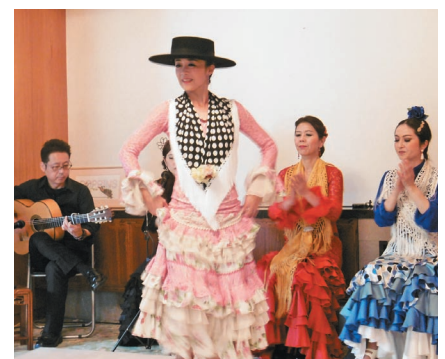
フラメンコショー