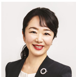
株式会社 ポピンズ 代表取締役社長