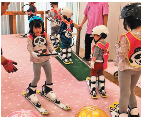
徐々に落差とスピードに慣れ、ゲーム感覚で滑れるようになります。

東京ミッドタウンのアクティブラーニングスクールでは、毎年キッズスキーレッスンを開催しています。今年もたくさんのお子様に参加され、スクール内に設置された人工ゲレンデでスキー靴を履いて滑る感覚を楽しみました。このレッスンはスキー場デビュー前の良い練習になるだけでなく、お子様の集中力や身体の調整能力の成長にもつながります。滑っているときは真剣そのもので、滑り終わった後の安堵の表情と爽快感からくるお子様の笑顔がとても印象的でした。このレッスンは毎年行っておりますので、来年のご受講をぜひお待ち申し上げております。