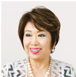
株式会社 ポピンズホールディングス 代表取締役会長