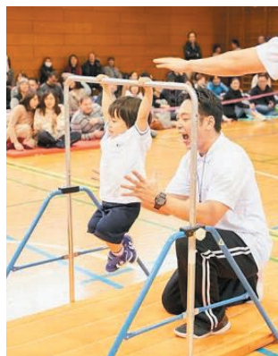
鉄棒： 1、2、3、落ちないでがんばれ！

【お問合せ】 03-5791-2105 または palis@poppins.co.jp