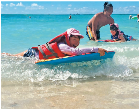
ワイキキビーチでボディボード

日本企業としてはハワイ州唯一の公認キッズルーム「ポピンズ・ケイキ・ハワイ」。シェラトンワイキキのオーシャンビューのスイートルームで世界中から訪れるお子様達をお預かりしています。一番人気は美しいビーチでのボディ