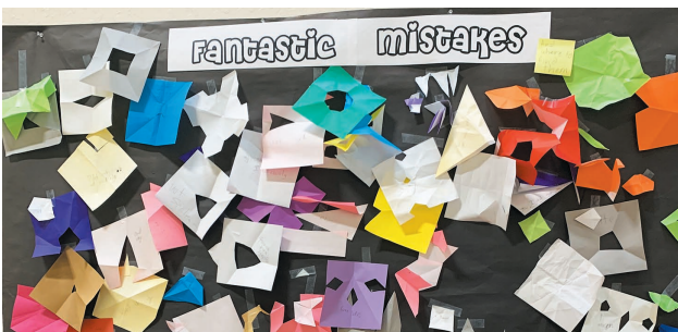
シナプススクール

詳しくは、こちら（ https://www.facebook.com/PoppinsCorporation/posts/2602509316451809 ）をご覧ください。