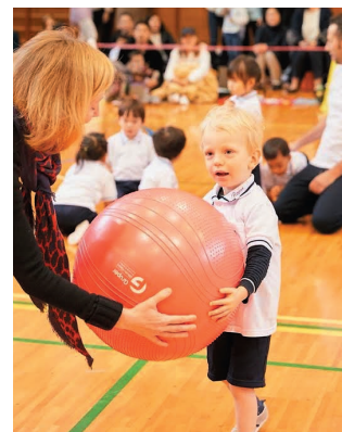
ボール運び： ママといっしょにがんばるぞ！